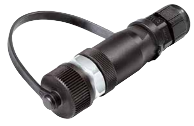
Kabelstecker, Schraubklemmanschluss, Kunststoffausführung