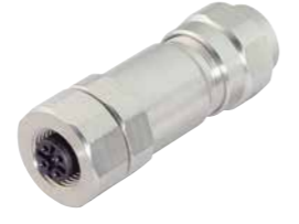
Kabeldose, Schraubklemmanschluss, mit Schirmring, Edelstahl ausführung, schirmbar