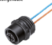
Flanschdose mit Litzen, AWG 24, Kunststoffgehäuse