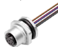
Flanschdose, von vorn verschraubbar, mit Litzen, AWG 24, Metallgehäuse