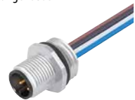
Flanschstecker mit Litzen, AWG 24, Metallgehäuse