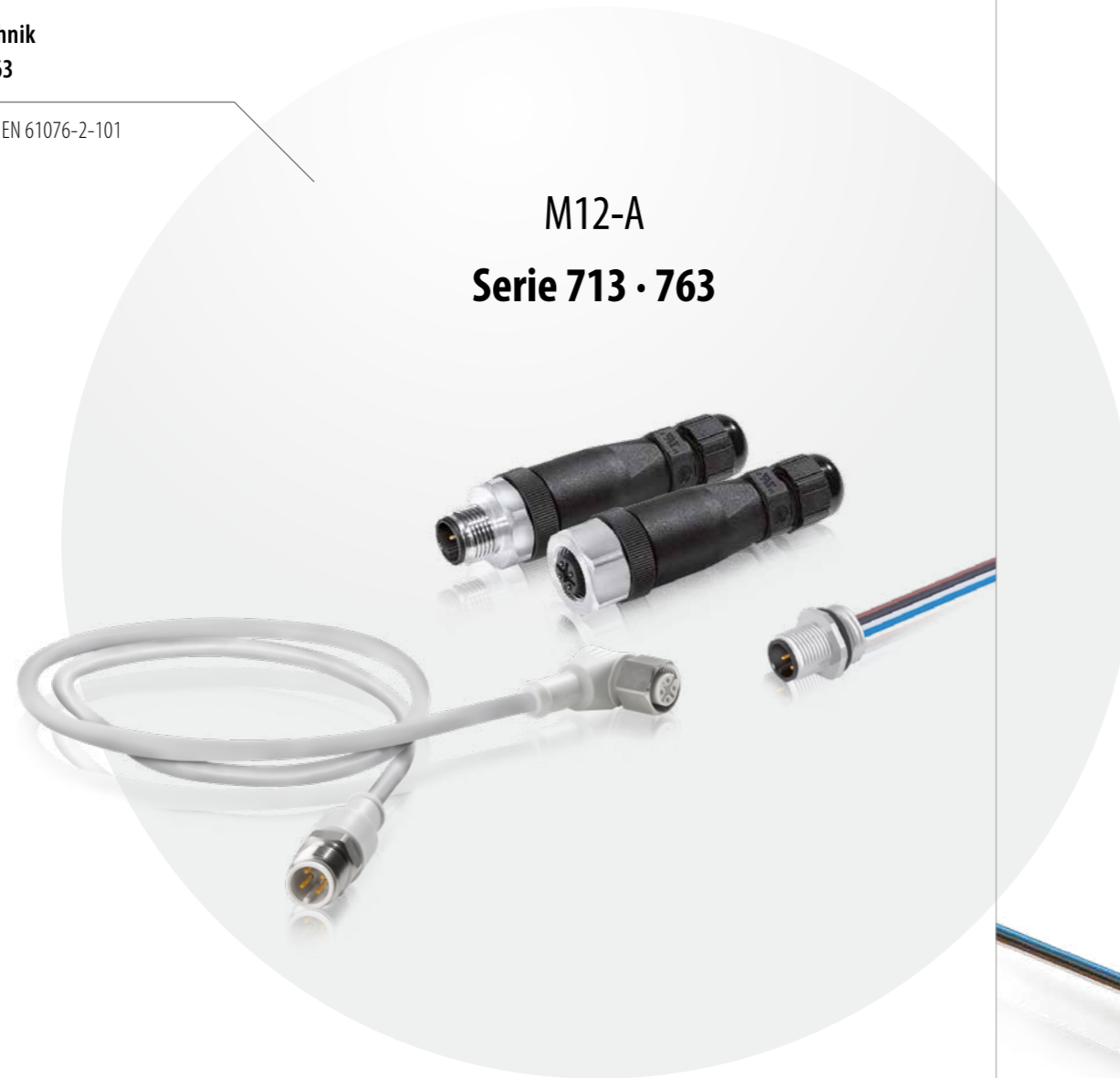
M12-A Serie 713 · 763