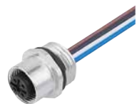
Flanschdose mit Litzen, AWG 24, Metallgehäuse