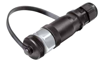
Kabeldose, Schraubklemmanschluss, Kunststoffausführung