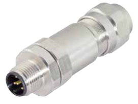
Kabelstecker, Schraubklemmanschluss, mit Schirmring, Edelstahl ausführung, schirmbar