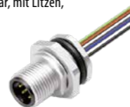
Flanschstecker, von vorn verschraubbar, mit Litzen, AWG 24, Metallgehäuse