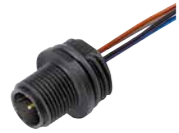
Flanschstecker mit Litzen, AWG 24, Kunststoffgehäuse