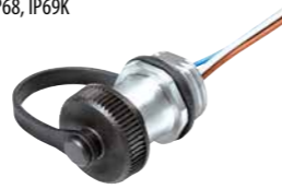
Flanschdose mit Litzen, AWG 24, IP68, IP69K